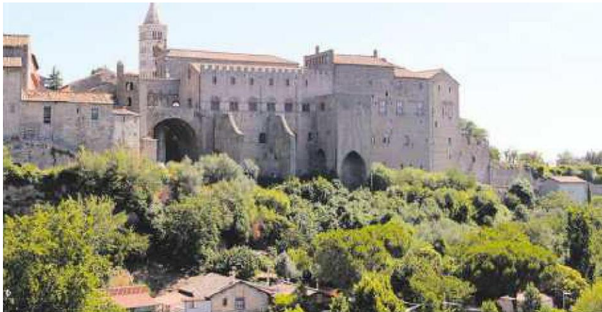
POTERE Il Palazzo papale di Viterbo. Sotto nei tondi a partire dall'alto, Papa Giovanni XXI e Papa Niccolò III